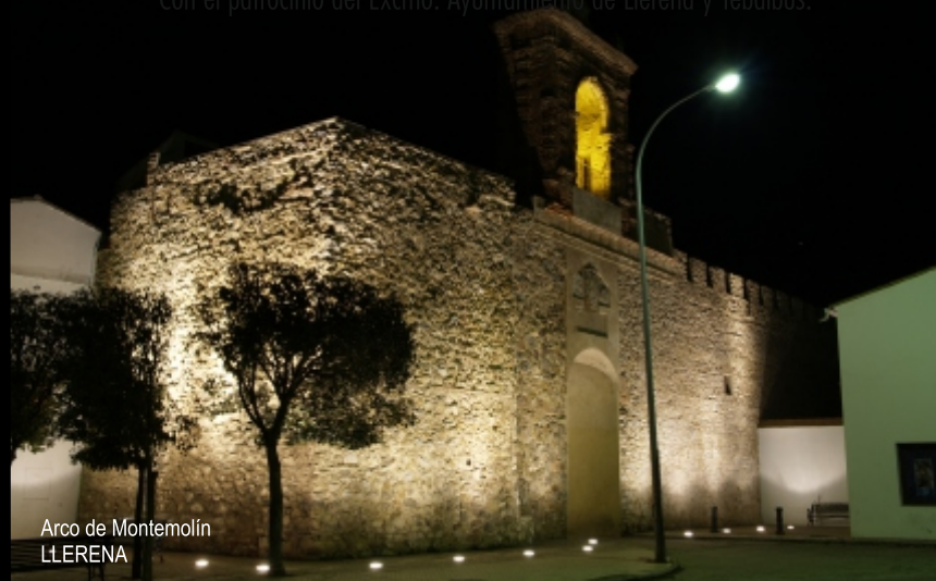
Arco de Montemolín LLERENA

Con el patrocinio del Excmo. Ayuntamiento de Llerena y Tebalbus.